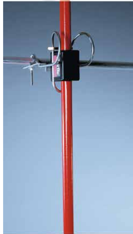
Der flexible gefederte Befestigungsbügel wurde entwickelt, um den Bewegungen von Turbulenzen zu widerstehen. Die Fiberglas Teleskopstange ist ausziehbar bis 4 m und kann leicht zur Inspektion entfernt werden.