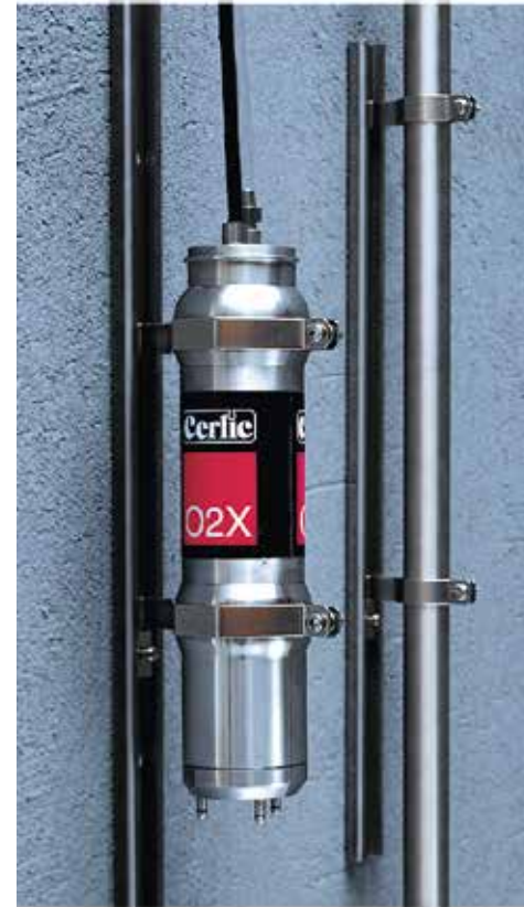
Montageschiene aus SS316 für einfache Installation und Wartung. Erhältlich in zwei Größen Ø20mm für pHX, ReX und FLX und Ø66mm für O2X und ITX-Sensoren. Die Schiene hat einen verstellbaren Anschlag, ist einfach zu installieren und leicht zugänglich für Reinigung und Adjustierung der Sensoren.