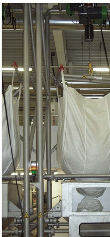
Illustration: Station en tube d'acier inox

De prime abord, les stations BIG BAG d'HUMBERT & POL sont intégrables à toutes vos lignes de conditionnement. Indépendamment de dispositifs tels que couvercles de goulotte de remplissage avec tubulures d'aspiration pour poussières ou trémie tampon pour poudres non volatiles, elles peuvent être agrémentées de divers accessoires :